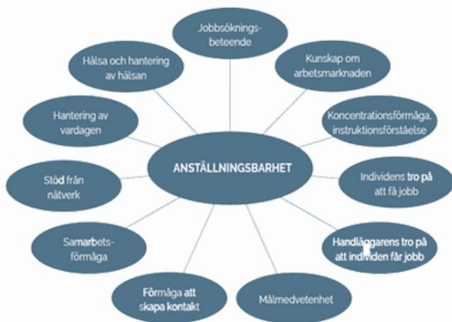
Bild: De elva BIP-indikatorerna för anställningsbarhet

I forskningsprojektet har elva indikatorer för anställningsbarhet utvecklats. Indikatorerna har testats som ett verktyg för att mäta progression i individers arbetslöshetsförlopp. Det är inte progressionsmätningarna i sig som får arbetslösa individer att komma närmare arbetsmarknaden. De faktorer som är mest avgörande för att en person med komplexa problem ska komma i arbete är; handledarens tilltro till att individen kommer i arbete; att ha samma handledare under hela perioden; kontinuerliga insatser utan avbrott; arbeta med individens helhet och att parallellt arbeta exempelvis med hälsa, vägledning, praktik etc. Hela tiden fokus på arbete/studier.